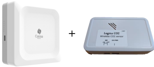
Cassia Networks E1000 BLEルーター ユニ電子製ワイヤレスCO2センサー